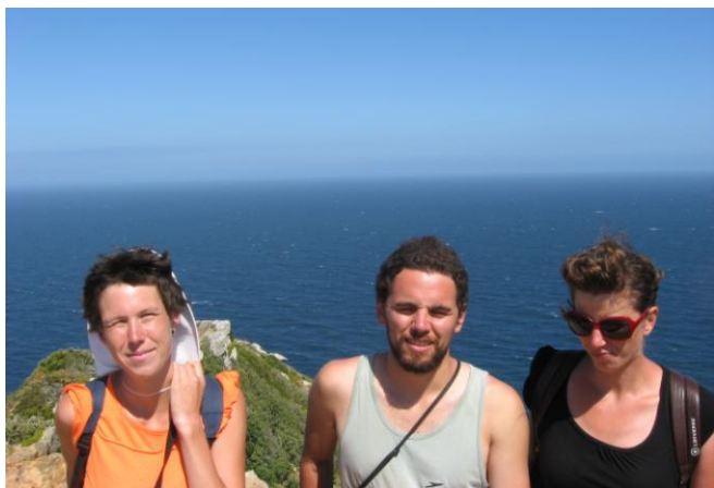
Cape Point – vidíte ten rozdíl mezi Atlantským a Indickým? ☺