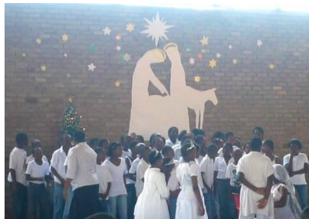
"Vánoční besídka" ve škole