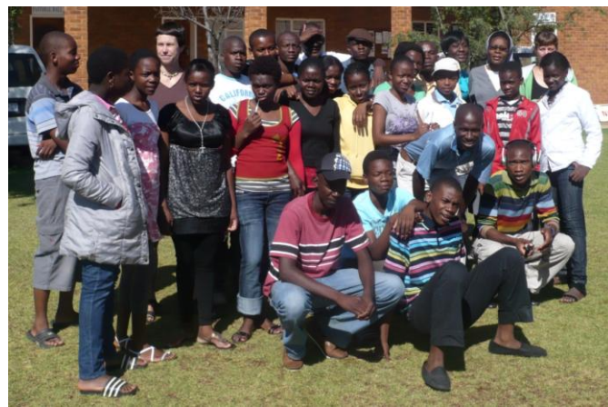
S mládežníky na "Love matters" v salesiánském Bosko centru