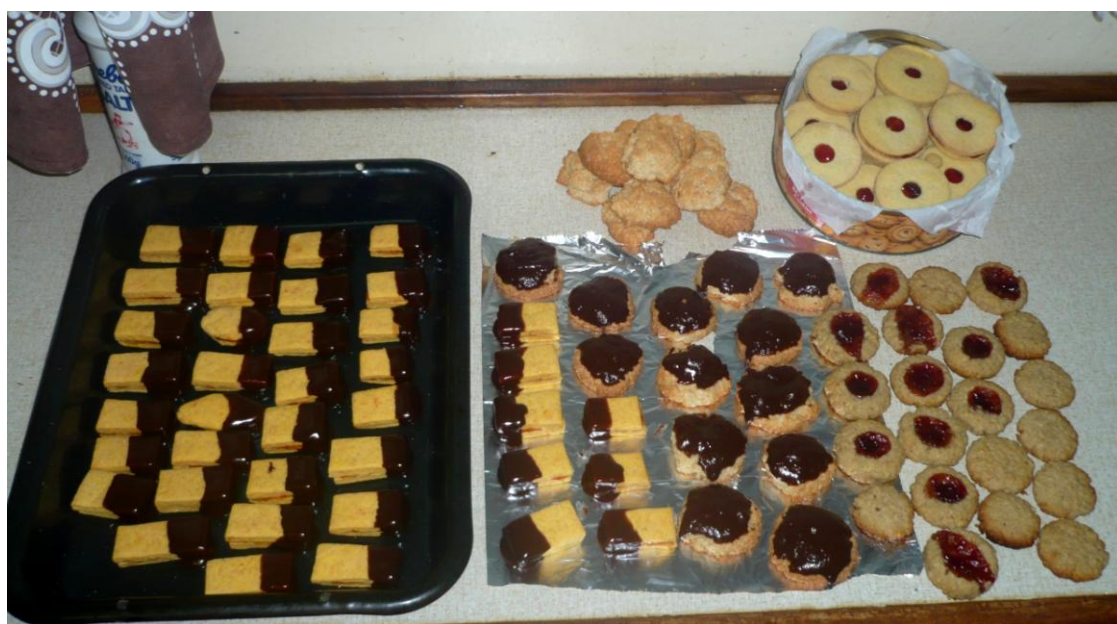
Naše pekařské umění – k zakousnutí, což?