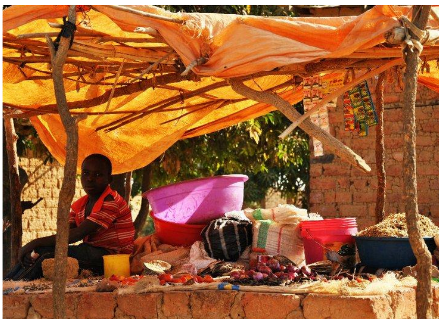
Kasungami, prodejní stánek