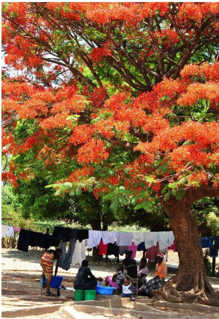
Kipushi, prádelna pod stromem