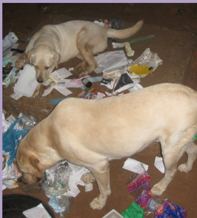
A na záver dôkaz, čo nám to tie psy vyviedli ☺!